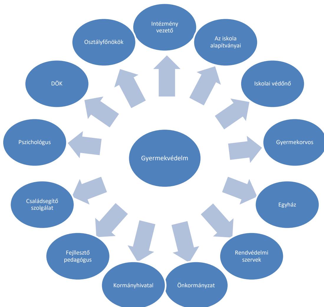
1. ábra: A Jászai Mari Általános Iskola és AMI intézményén belüli és kívüli kapcsolatai

A tanulók fejlődését veszélyeztető okok megszüntetésének érdekében az iskola és a munkacsoport együttműködik a Családsegítővel, az Önkormányzattal, az illetékes Kormányhivatallal stb., továbbá a gyermekvédelemben résztvevő különböző társadalmi szervezetekkel.